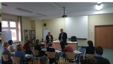
Zdjęcie nr 2 uczestników szkolenia