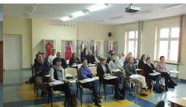
Zdjęcie nr 3 uczestników szkolenia