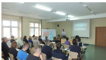
Zdjęcie nr 4 uczestników szkolenia