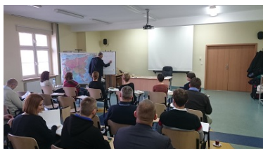
Zdjęcie nr 1 uczestników szkolenia

W dniach 04-06.11.2015 r. w Ośrodku Szkoleń Specjalistycznych SG w Lubaniu przeprowadzono szkolenie w formie warsztatów pt. „Warsztaty dot. wymiany doświadczeń na temat orzecznictwa w zakresie udzielania cudzoziemcom ochrony (ochrona wynikająca z Konwencji Genewskiej oraz Rzymskiej)”.