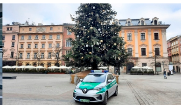
Nowe Renault Zoe w trasie