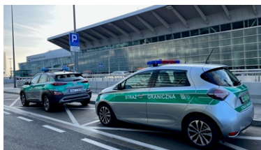
Nowe samochody przy Lotnisku Chopina