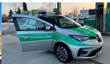
Nowe Renault Zoe w trasie