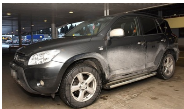
Samochód zabezpieczony na przejściu w Korczowej

Na drogowym przejściu granicznym w Korczowej udaremniono również wywiezienie z Polski terenowej toyoty RAV4. Jej kierowcą był 35-letni obywatel Polski. Ustalono, że w aucie wymieniono tabliczkę znamionową, zawierającą dane identyfikacyjne. Stwierdzono również ingerencję w pole numerowe VIN samochodu. Wczoraj, 2 stycznia, również na przejściu granicznym w Korczowej zatrzymano transport podzespołów, pochodzących z auta skradzionego 30 grudnia na terytorium Polski. Funkcjonariusze SG ustalili, że elementy karoserii (maska, drzwi, zderzaki oraz błotniki) pochodzą z luksusowego audi A6, poszukiwanego m.in. przez Interpol.