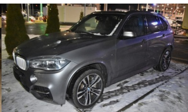
BMW X5 odzyskane na przejściu w Medyce