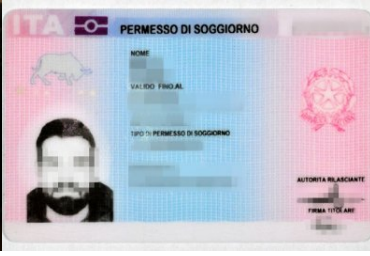
ujawniony fałszywy dokument