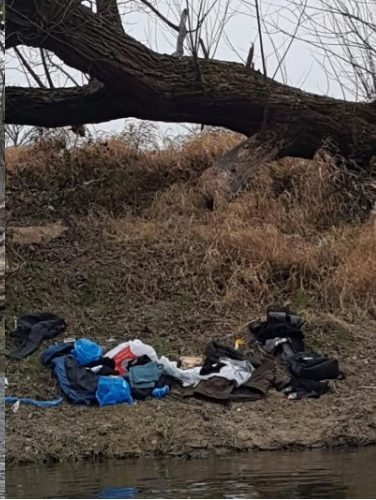
Mokre ubrania porzucone na brzegu Bugu