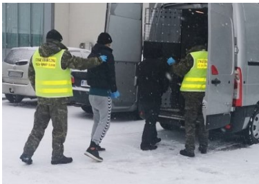
Zatrzymani imigranci wsiadają do pojazdu służbowego SG,