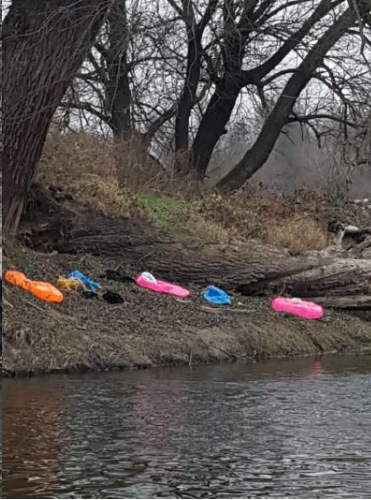
Dmuchańce porzucone na brzegu Bugu