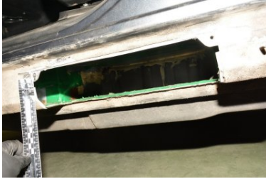
Narkotyki ukryte w samochodzie