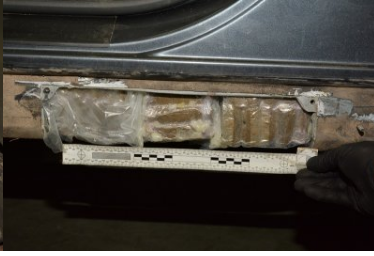
Narkotyki ukryte w samochodzie