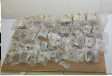
Narkotyki ukryte w samochodzie