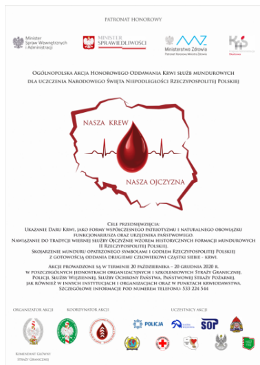
Akcja "Nasza Krew - Nasza Ojczyzna"