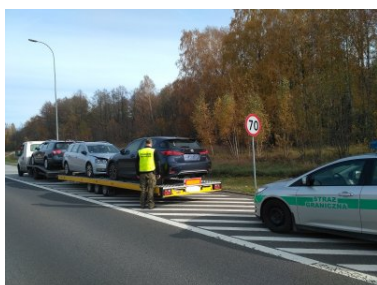
Kierowca i jego pasażer przewozili samochody osobowe lawetą