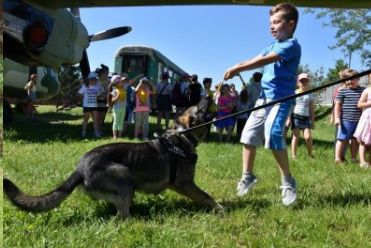
psy służbowe Straży Granicznej