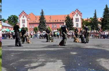
psy służbowe Straży Granicznej