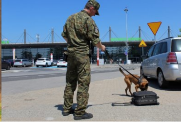
psy służbowe Straży Granicznej