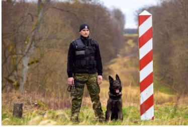
psy służbowe Straży Granicznej