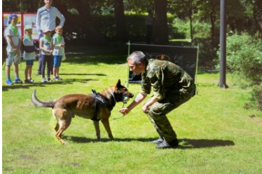
psy służbowe Straży Granicznej