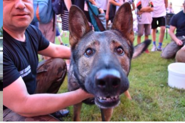
psy służbowe Straży Granicznej