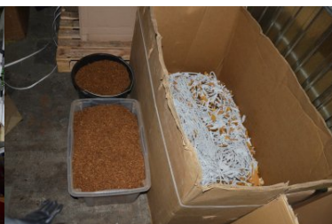
Zlikwidowano nielegalną wytwórnię papierosów