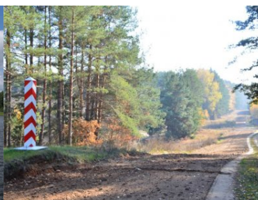
Sztafeta Wokół Niepodległej