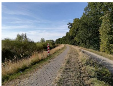
Sztafeta Wokół Niepodległej