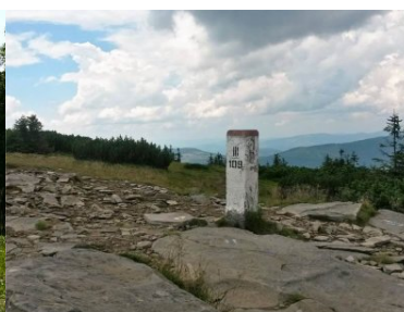
Sztafeta Wokół Niepodległej