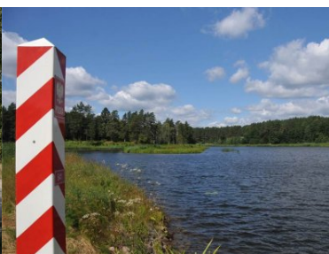
Sztafeta Wokół Niepodległej