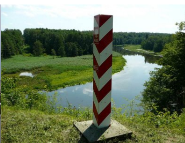
Sztafeta Wokół Niepodległej