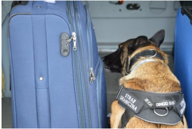
Idea z Nadbużańskiego OSG