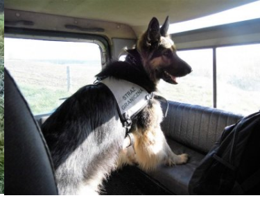
Juka z Warmińsko-Mazurskiego OSG