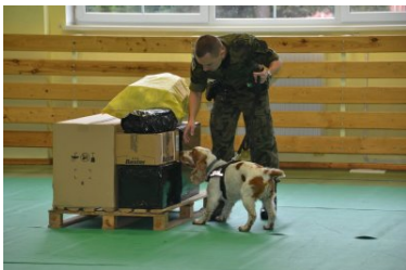
psy służbowe w Ośrodku Szkoleń Specjalistycznych SG