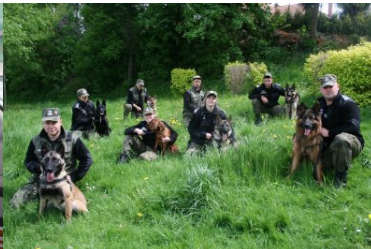
psy służbowe w Ośrodku Szkoleń Specjalistycznych SG