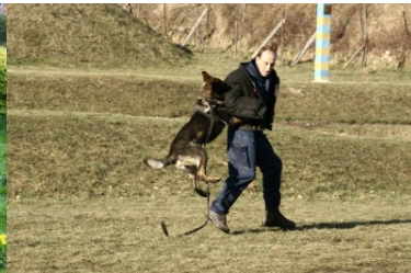
psy służbowe w Ośrodku Szkoleń Specjalistycznych SG