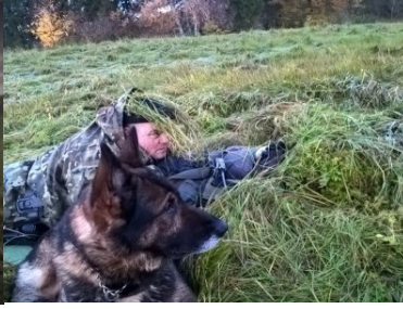
Hardo z Warmińsko-Mazurskiego OSG