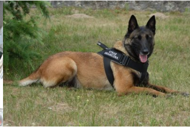
Idea z Nadbużańskiego OSG