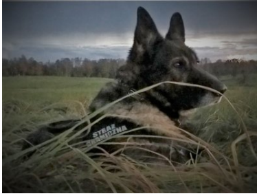
Hardo z Warmińsko-Mazurskiego OSG