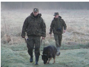
Jankes z Warmińsko-Mazurskiego OSG