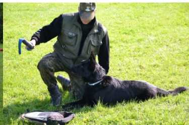
psy służbowe w Ośrodku Szkoleń Specjalistycznych SG