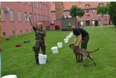
psy służbowe w Ośrodku Szkoleń Specjalistycznych SG