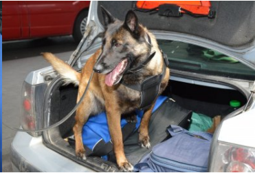
Idea z Nadbużańskiego OSG