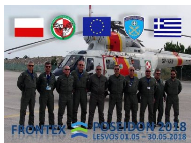
misja POSEIDON 2018