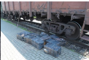
pakunki z kontrabandą