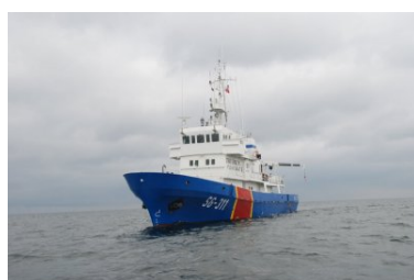
jednostka pływająca SG-311