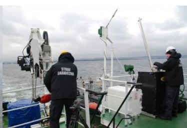
zdalnie sterowany dźwig