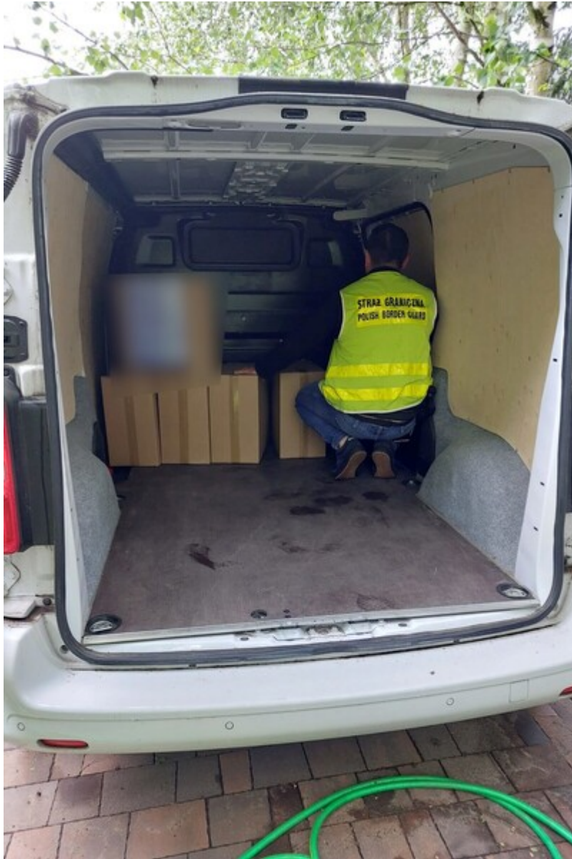
Funkcjonariusz SG podczas wykonywania czynności służbowych