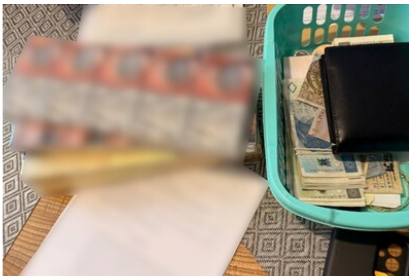
Wyroby tytoniowe i środki pieniężne