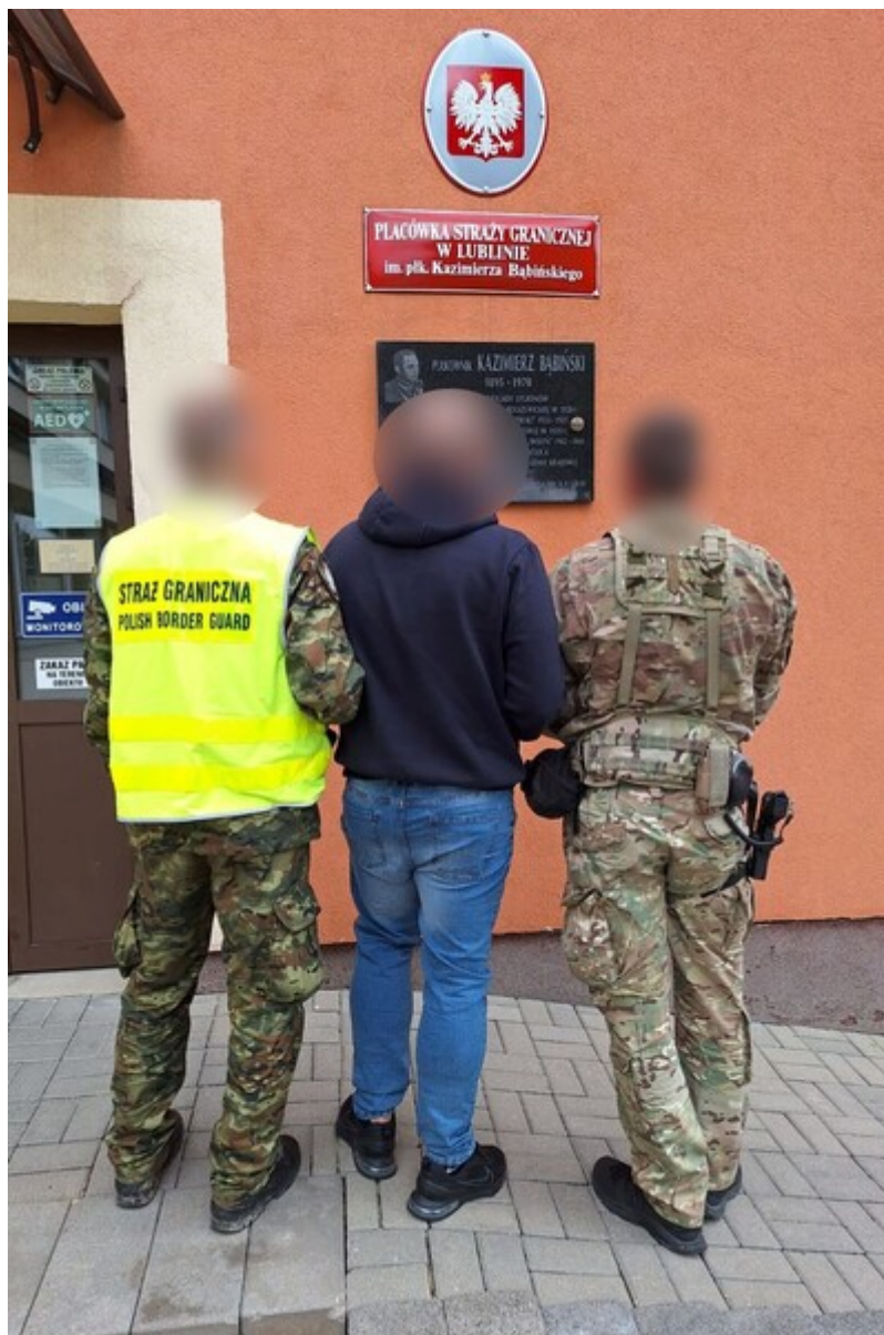
Funkcjonariusze SG z osobą zatrzymaną