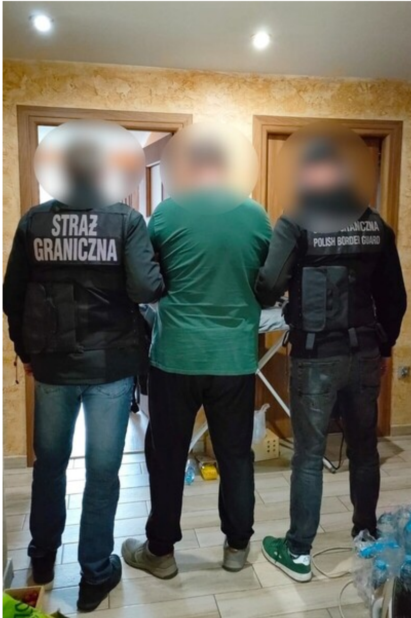
Funkcjonariusze SG z osobą zatrzymaną