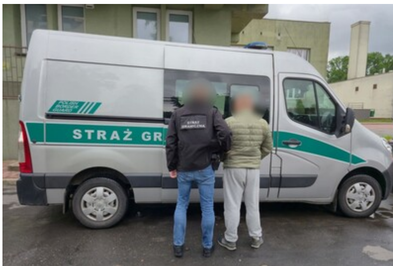
Funkcjonariusz SG z osobą zatrzymaną