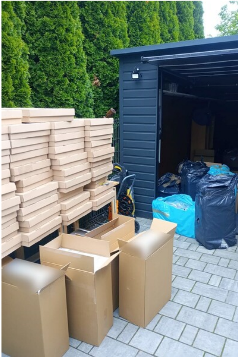
Wyroby tytoniowe znajdujące się przy budynku gospodarczym