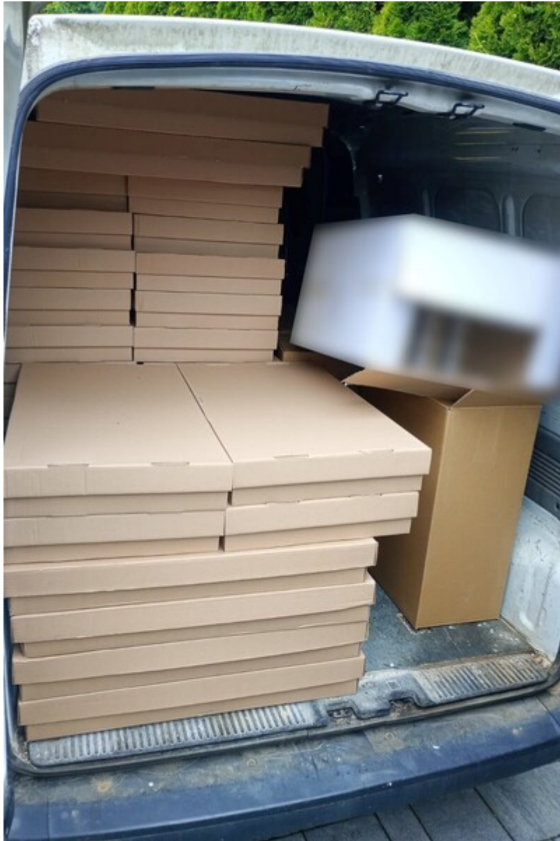
Wyroby tytoniowe znajdujące się w pojeździe