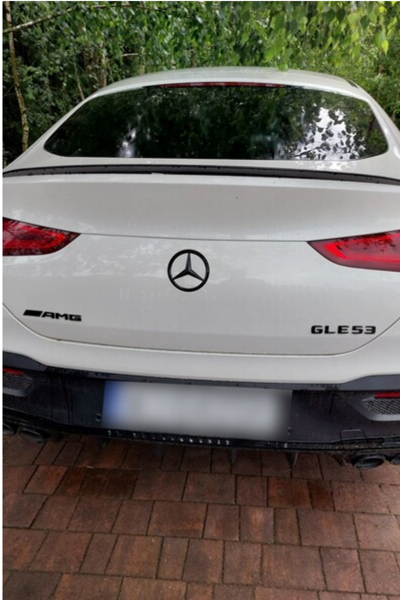
Pojazd marki Mercedes