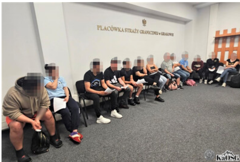
Trzynastu cudzoziemców z fałszywymi zezwoleniami na pracę