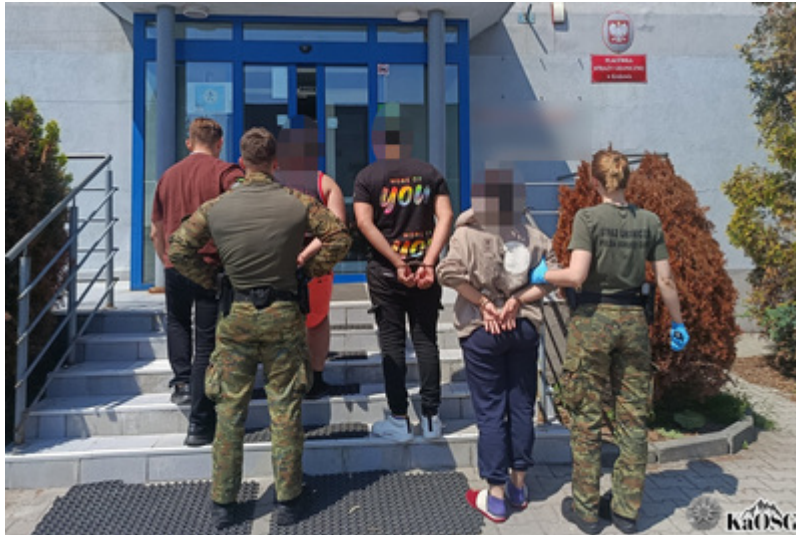
Trzynastu cudzoziemców z fałszywymi zezwoleniami na pracę