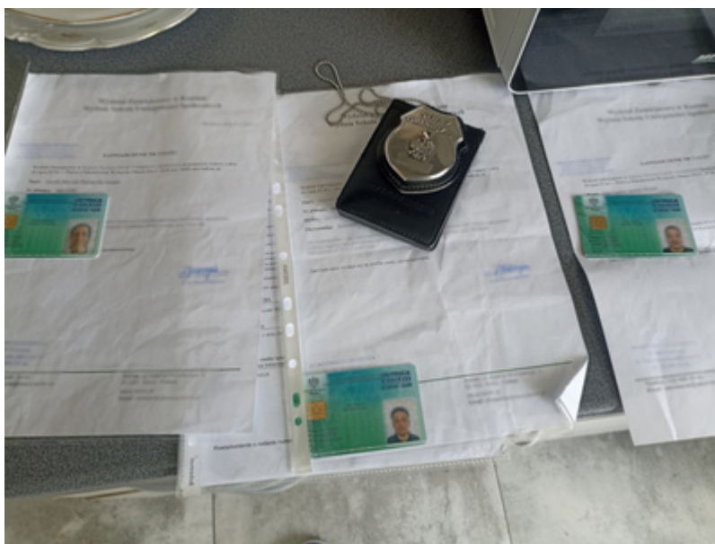
Czerpali korzyści z legalizowania Kolumbijczykom pracy