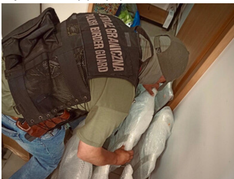
Czerpali korzyści z legalizowania Kolumbijczykom pracy