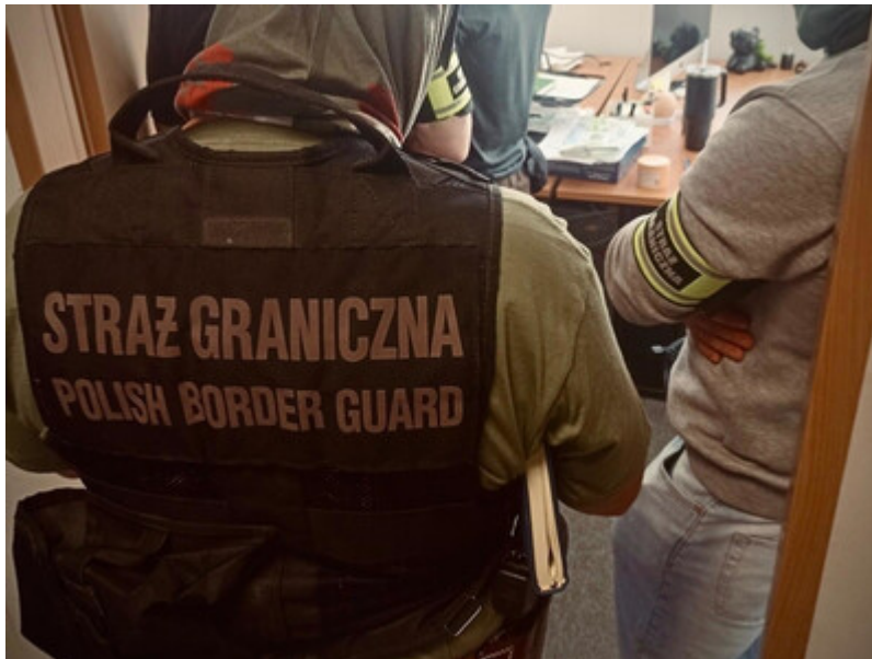
Czerpali korzyści z legalizowania Kolumbijczykom pracy