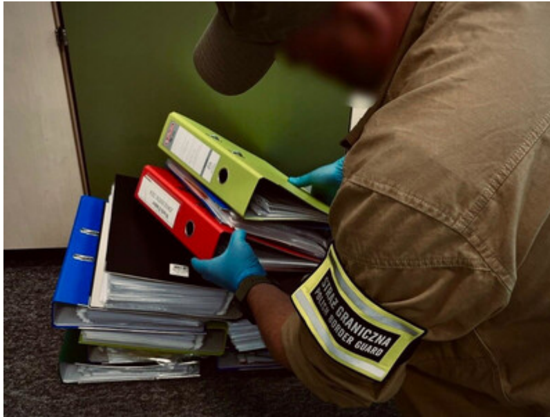
Czerpali korzyści z legalizowania Kolumbijczykom pracy