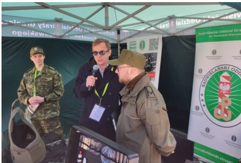
Festiwal zawodów mundurowych

Udział w wydarzeniu był doskonałą okazją do bezpośredniego kontaktu z funkcjonariuszami oraz poznania realiów służby „od środka”. Takie spotkania pokazują, że mundur to nie tylko zawód, ale przede wszystkim odpowiedzialna i stabilna ścieżka kariery, dająca realny wpływ na bezpieczeństwo państwa.