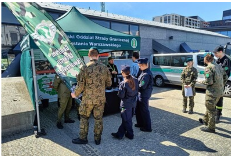
Festiwal zawodów mundurowych