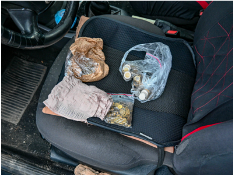
Zatrzymane środki finansowe