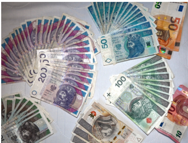
Zatrzymane środki finansowe