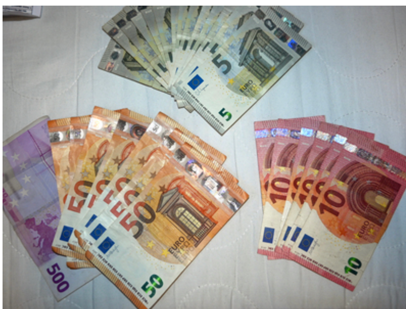
Zatrzymane środki finansowe