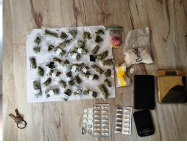
Zatrzymane środki odurzające i dokumenty.