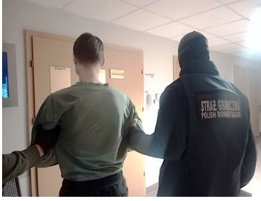
Funkcjonariusz SG z zatrzymanym mężczyzną.