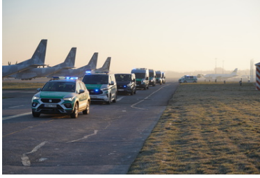
Pojazdy służbowe Straży Granicznej na płycie lotniska w tle samoloty