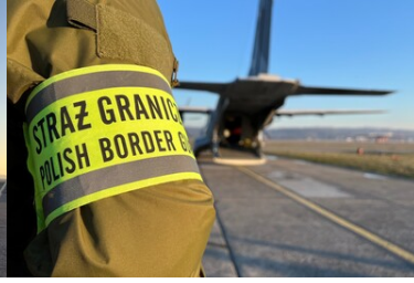
Funkcjonariusz Straży Granicznej przed wejściem do samolotu