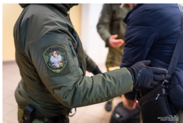
Funkcjonariusz Straży Granicznej podczas wykonywania czynności służbowych