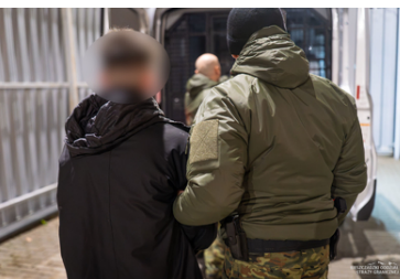
Funkcjonariusz Straży Granicznej podczas wykonywania czynności służbowych