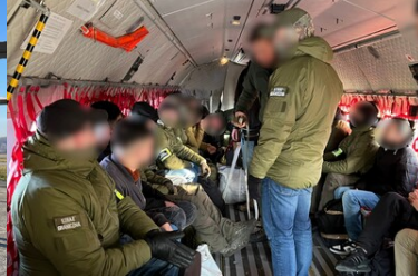
Funkcjonariusze Straży Granicznej podczas wykonywania czynności służbowych z cudzoziemcami