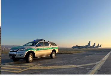
Pojazd służbowy Straży Granicznej na płycie lotniska w tle samoloty