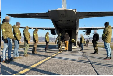
Funkcjonariusze Straży Granicznej z cudzoziemcami przed wejściem do samolotu