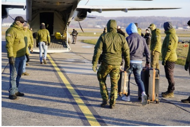
Funkcjonariusze Straży Granicznej podczas wykonywania czynności służbowych z cudzoziemcami