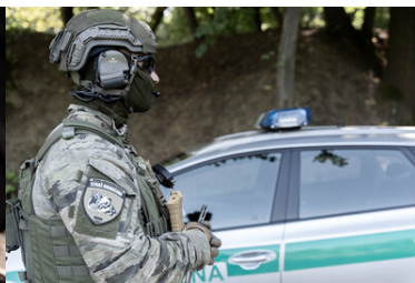
Funkcjonariusze Straży Granicznej przy pojeździe służbowym