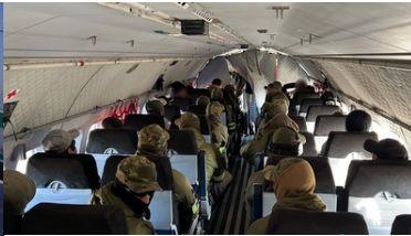
Funkcjonariusze eskortują cudzoziemców