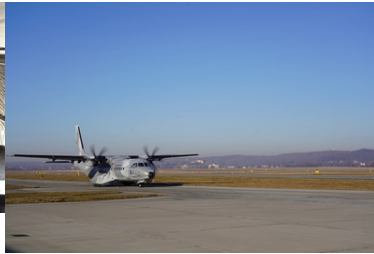
Samolot transportujący cudzoziemców