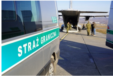
Pojazd Straży Granicznej za nim samolot transportowy z funkcjonariuszami SG eskortującymi cudzoziemców