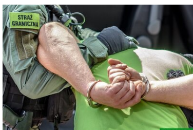
Kajdanki na rękach zatrzymanego.

Mężczyzna został zatrzymany w związku ze znieważeniem funkcjonariuszy oraz za naruszeniem nietykalności cielesnej podczas lub w związku z pełnieniem obowiązków służbowych. Przewieziono go do policyjnych pomieszczeń dla osób zatrzymanych. Po wytrzeźwieniu zostaną mu przedstawione zarzuty.