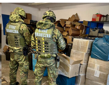
Funkcjonariusze Straży Granicznej przy kartonach z papierosami.