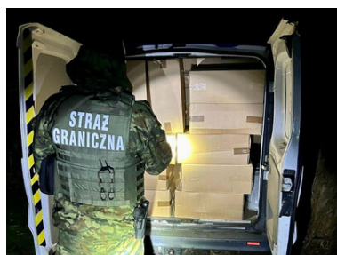
Funkcjonariusz Straży Granicznej obok przestrzeni bagażowej pojazdu.

Dalsze postępowanie w tej sprawie prowadzi Straż Graniczna.