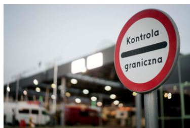
Znak kontrola graniczna.

Od początku 2024 roku strażnicy graniczni z Podkarpacia wykryli podczas kontroli granicznej 35 przerobionych książek Interbus oraz ponad 80 fałszywych praw jazdy.