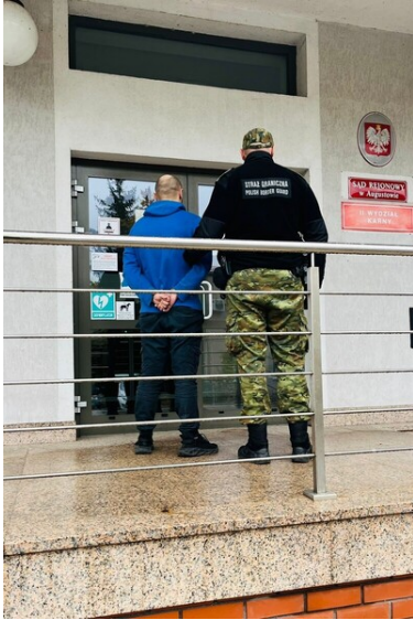
Funkcjonariusze SG z zatrzymanymi cudzoziemcami