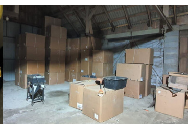
Funkcjonariusze ujawnili znaczne ilości nielegalnego tytoniu.