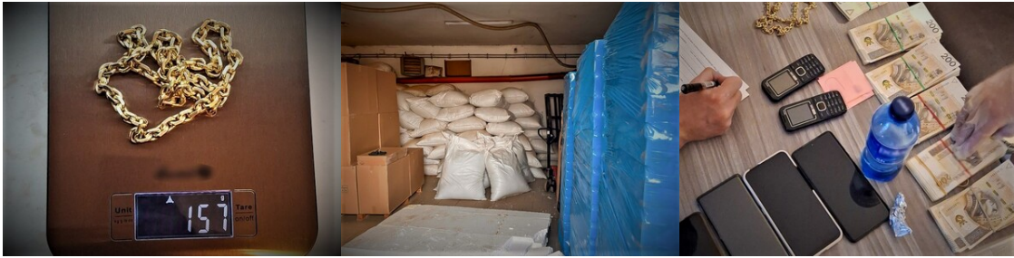
Połączyli siły i rozbili tytoniowy gang