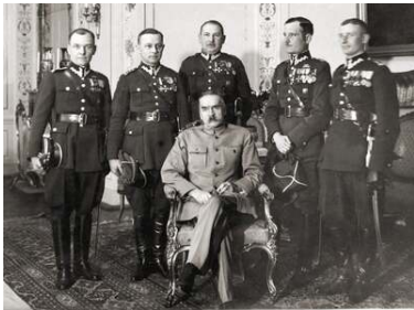
Płk Jan Kruszewski na czele delegacji 1 Dywizji Piechoty Legionów z wizytą u marszałka Józefa Piłsudskiego