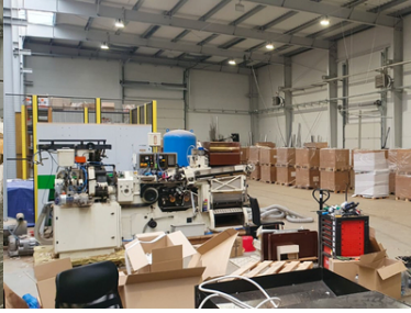
Zlikwidowana nielegalna fabryka papierosów