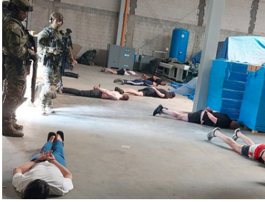
Zlikwidowana nielegalna fabryka papierosów