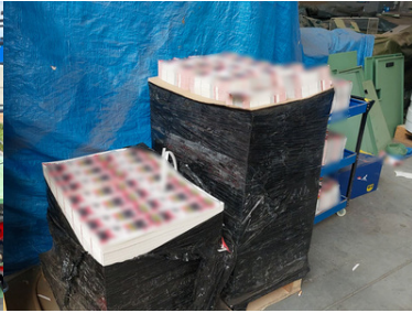
Zlikwidowana nielegalna fabryka papierosów