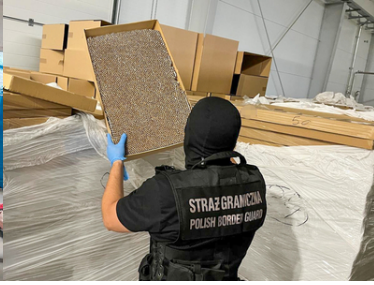
Zlikwidowana nielegalna fabryka papierosów