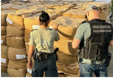
Wspólna akcja BiOSG, KAS i CBSP na Śląsku