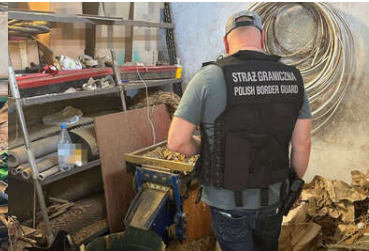
Wspólna akcja BiOSG, KAS i CBSP na Śląsku