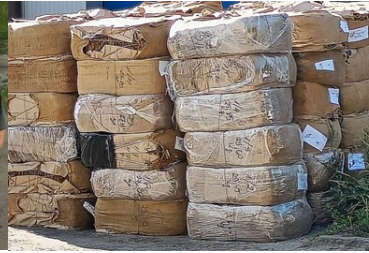
Wspólna akcja BiOSG, KAS i CBSP na Śląsku