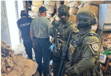
Wspólna akcja BiOSG, KAS i CBSP na Śląsku