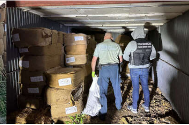
Wspólna akcja BiOSG, KAS i CBSP na Śląsku