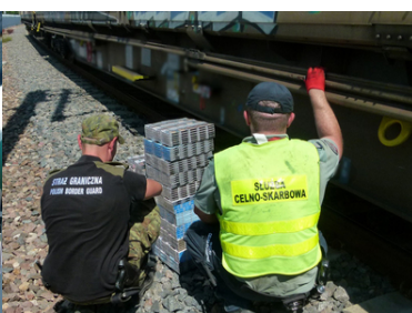
Nielegalne papierosy na przejściu kolejowym w Terespolu