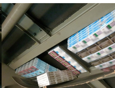
Nielegalne papierosy na przejściu kolejowym w Terespolu