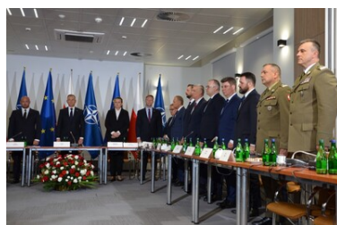
Posiedzenie Rady Bezpieczeństwa Narodowego w Podlaskim OSG.