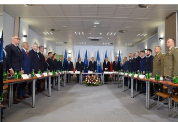
Posiedzenie Rady Bezpieczeństwa Narodowego w Podlaskim OSG.