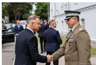
Komendant Główny SG wita Prezydenta RP

Omawiano także kwestie związane z bezpieczeństwem polskich żołnierzy oraz prezydencki projekt ustawy o działaniach organów władzy państwowej na wypadek zewnętrznego zagrożenia bezpieczeństwa państwa.