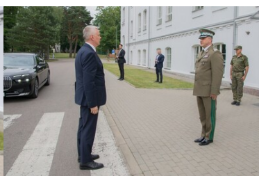
Komendant Główny SG składa meldunek MSWiA.