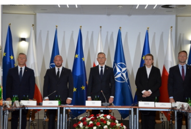
Posiedzenie Rady Bezpieczeństwa Narodowego w Podlaskim OSG.