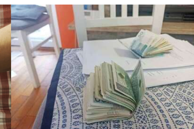
Działania funkcjonariuszy z PSG w Radomiu