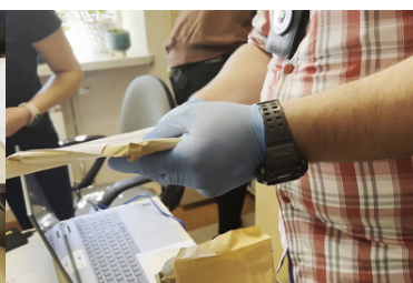
Działania funkcjonariuszy z PSG w Radomiu