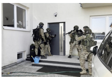
Działania funkcjonariuszy z PSG w Radomiu