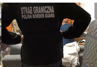
Działania funkcjonariuszy z PSG w Radomiu