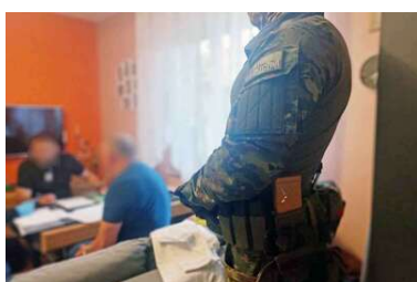
Działania funkcjonariuszy z PSG w Radomiu