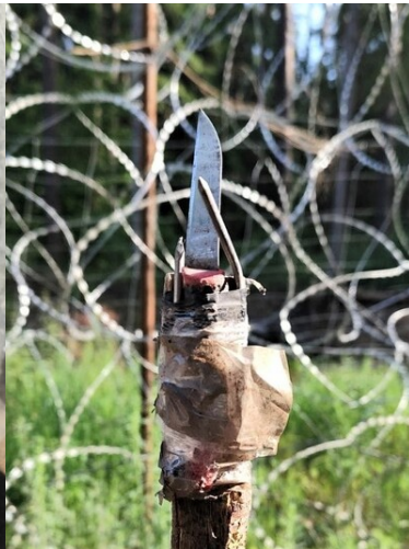
Dzida używana przez cudzoziemców do ataków na polskie służby