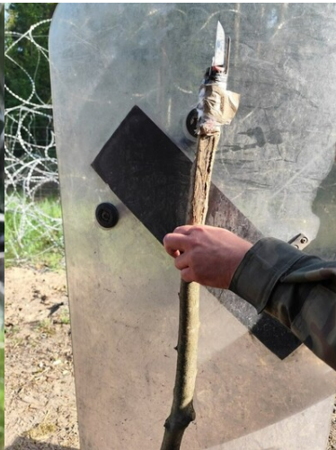
Dzida używana przez cudzoziemców do ataków na polskie służby