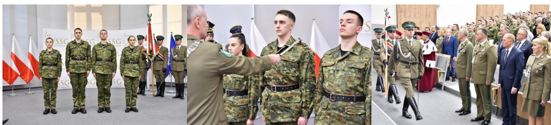
Pierwsza inauguracja roku akademickiego w Wyższej Szkole SG