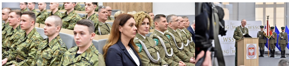
Pierwsza inauguracja roku akademickiego w Wyższej