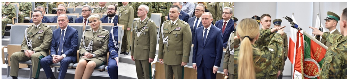
Pierwsza inauguracja roku akademickiego w Wyższej Szkole SG