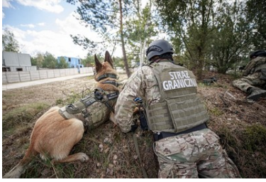
Extreme wraz ze swoim przewodnikiem