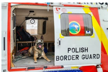
Extreme - czworonożny funkcjonariusz