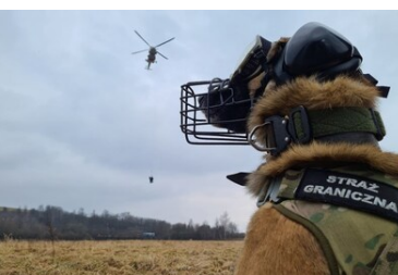
Extreme - czworonożny funkcjonariusz