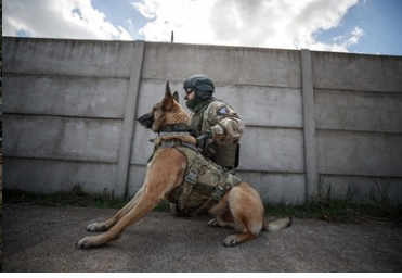
Extreme wraz ze swoim przewodnikiem