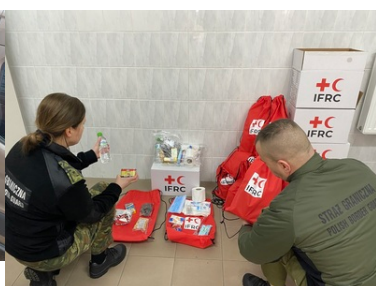
Pomoc humanitarna na granicy