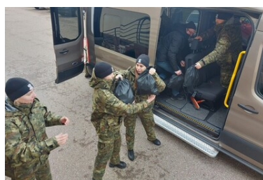
Pomoc humanitarna na granicy