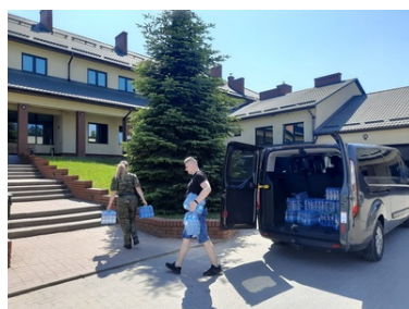
Pomoc humanitarna na granicy