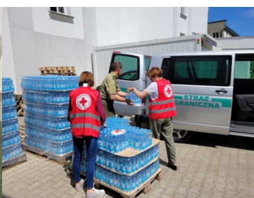
Pomoc humanitarna na granicy