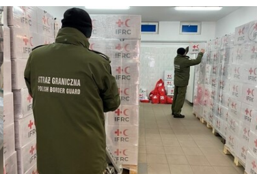
Pomoc humanitarna na granicy