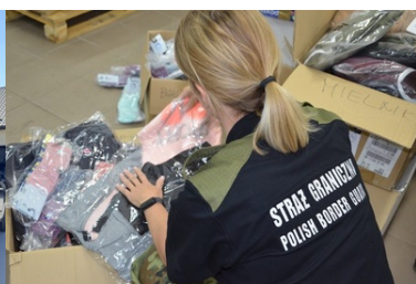
Pomoc humanitarna na granicy