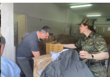
Pomoc humanitarna na granicy