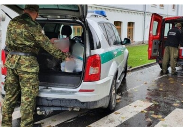
Pomoc humanitarna na granicy