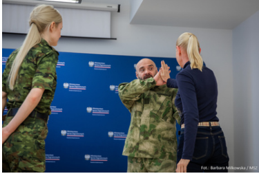
Warsztaty dla dyplomatów i pracowników MSZ