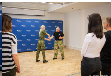
Warsztaty dla dyplomatów i pracowników MSZ