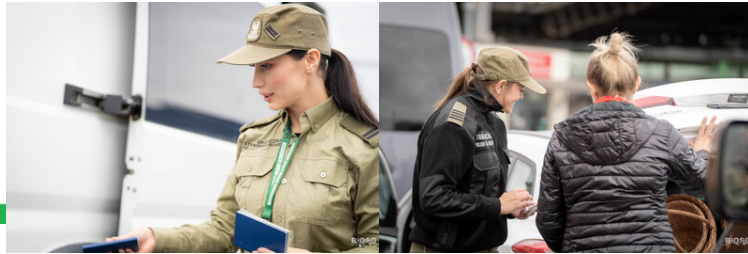
Funkcjonariusze Straży Granicznej