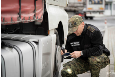
Funkcjonariusze Straży Granicznej