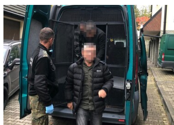
Funkcjonariusz SG zatrzymuje cudzoziemców