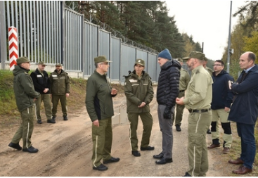
Wizyta delegacji fińskiej Straży Granicznej w POSG