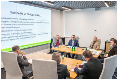
Wizyta delegacji fińskiej Straży Granicznej w KGSG