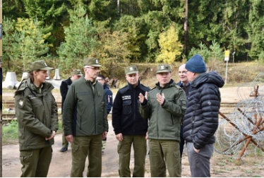
Wizyta delegacji fińskiej Straży Granicznej w POSG