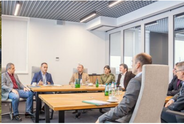
Wizyta delegacji fińskiej Straży Granicznej w KGSG