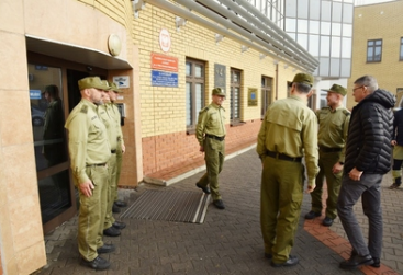
Wizyta delegacji fińskiej Straży Granicznej w Placówce SG w Kuźnicy