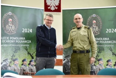
Wizyta delegacji fińskiej Straży Granicznej w POSG