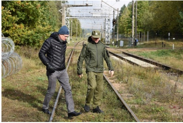
Wizyta delegacji fińskiej Straży Granicznej w POSG