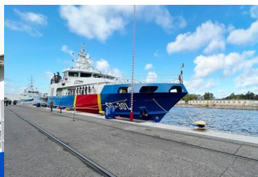
Jednostka patrolowa SG-301