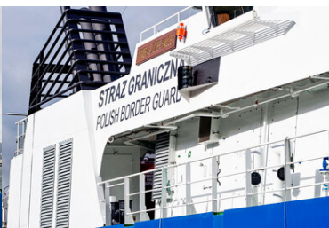
Jednostka patrolowa SG-301