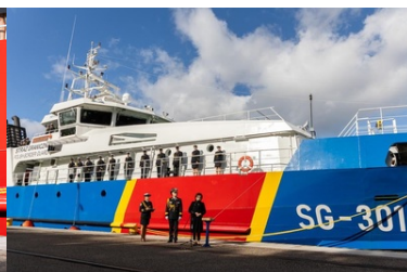
Marszałek Sejmu RP Elżbieta Witek przemawia w trakcie uroczystości pierwszego podniesienia bandery na nowej jednostce pływającej SG-301