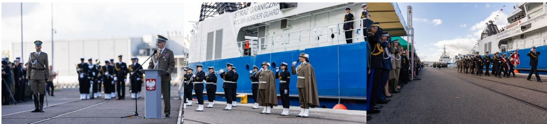
Gen. dyw. SG Tomasz Praga Komendant Główny SG przemawia w trakcie uroczystości pierwszego podniesienia bandery na nowej jednostce pływającej SG-301