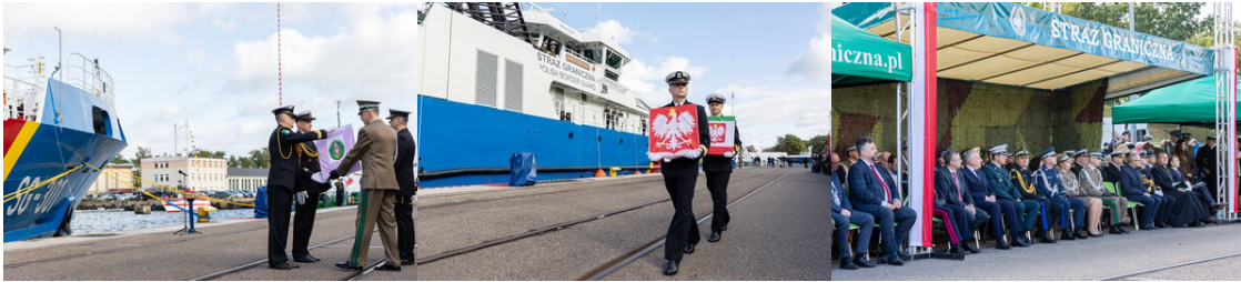
Przekazanie bandery i flagi SG Dowódcy jednostki i Zastępcy Dowódcy jednostki