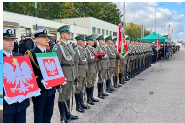
Funkcjonariusze SG przed nową jednostką pływającą SG-301