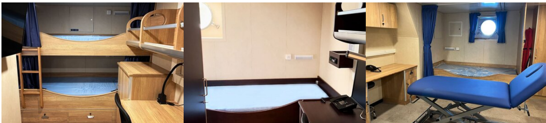
Kajuta w jednostce SG-301