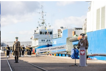
Gen. dyw. SG Tomasz Praga Komendant Główny SG przemawia w trakcie uroczystości pierwszego podniesienia bandery na nowej jednostce pływającej SG-301