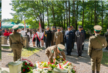
Uroczyste obchody 84. rocznicy bitwy pod Wytcznem