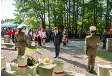
Uroczyste obchody 84. rocznicy bitwy pod Wytcznem