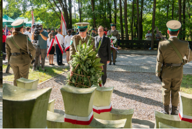
Uroczyste obchody 84. rocznicy bitwy pod Wytcznem