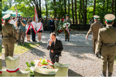
Uroczyste obchody 84. rocznicy bitwy pod Wytcznem