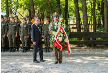
Uroczyste obchody 84. rocznicy bitwy pod Wytcznem