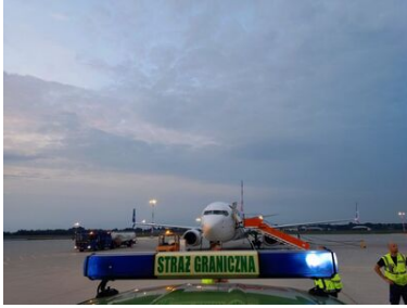
Operacja powrotowa do Gruzji