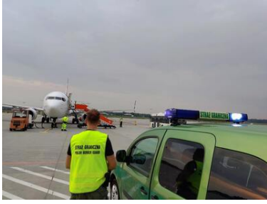
Operacja powrotowa do Gruzji