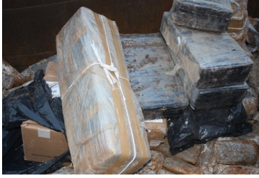
Kontrabanda zabezpieczona przez funkcjonariuszy SG i KAS