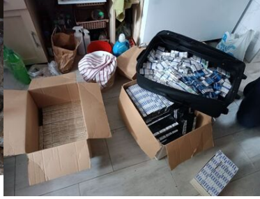
Kontrabanda zabezpieczona przez funkcjonariuszy SG i KAS