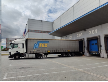
Naczepa samochodu ciężarowego