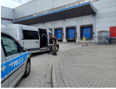
Zatrzymanie trzech obywateli Afganistanu