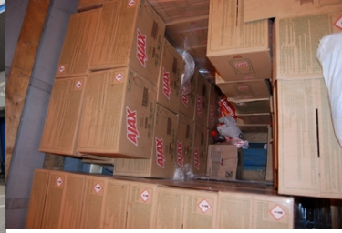
Miejsce ukrycia cudzoziemców