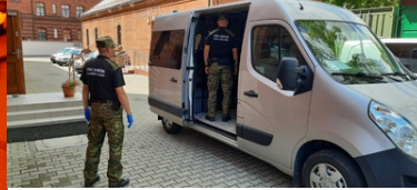
Samochód służbowy SG