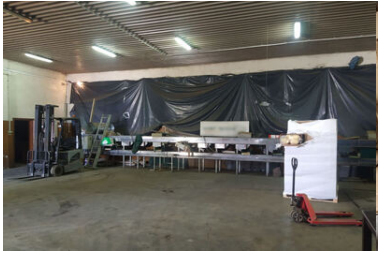
Pomieszczenie, w którym mieściła się nielegalna fabryka tytoniu