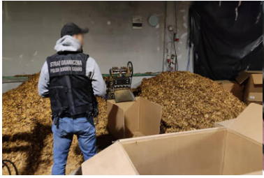
Funkcjonariusz SG w trakcie zabezpieczania nielegalnego towaru